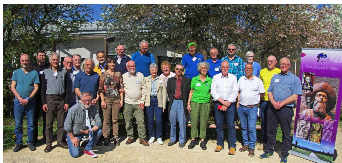
Membres du CA